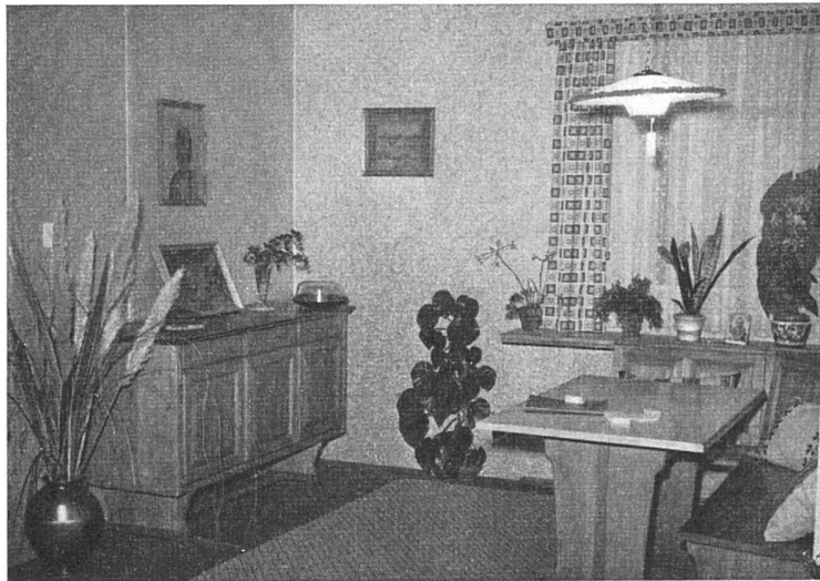
Eszimmer. Tücher aus Novopan natur