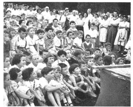
Aus dem kollektiven Leben in der Siedlung «Neubühl» / Trois exemples de la vie collective des habitants de la colonie «Neubühl» / About collective life in the garden-city «Neubühl»