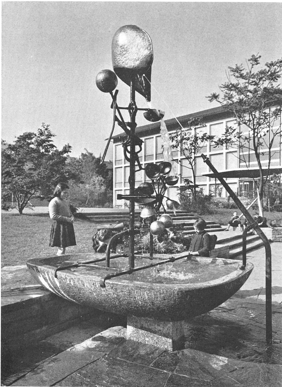
Robert Müller, Brunnen in der Schulhausanlage Kugeliloo, Zürich, 1954 | Fontaine de l'école de Kugeliloo, Zurich, 1954 | Fountain at Kugeliloo School, Zurich