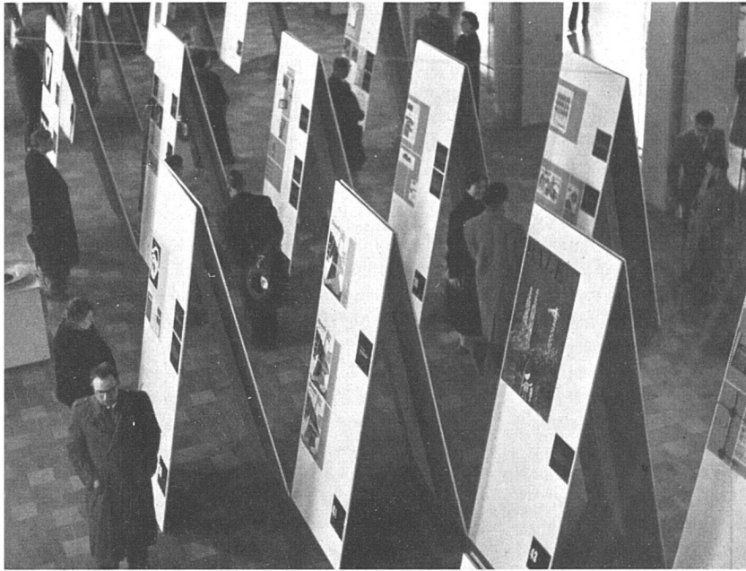
1 Thematischer Teil der Ausstellung Konzeption und Gestaltung: G. Honegger-Lavater VSG Partie thématique de l'exposition Thematic section of the exhibition