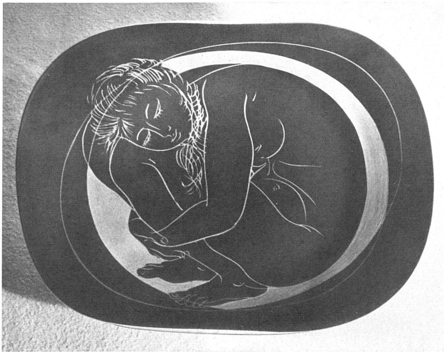
Hans Erni, Schlafendes Mädchen , 1953. Keramikschale | Jeune fille endormie; coupe de céramique | Sleeping Girl. Ceramic dish