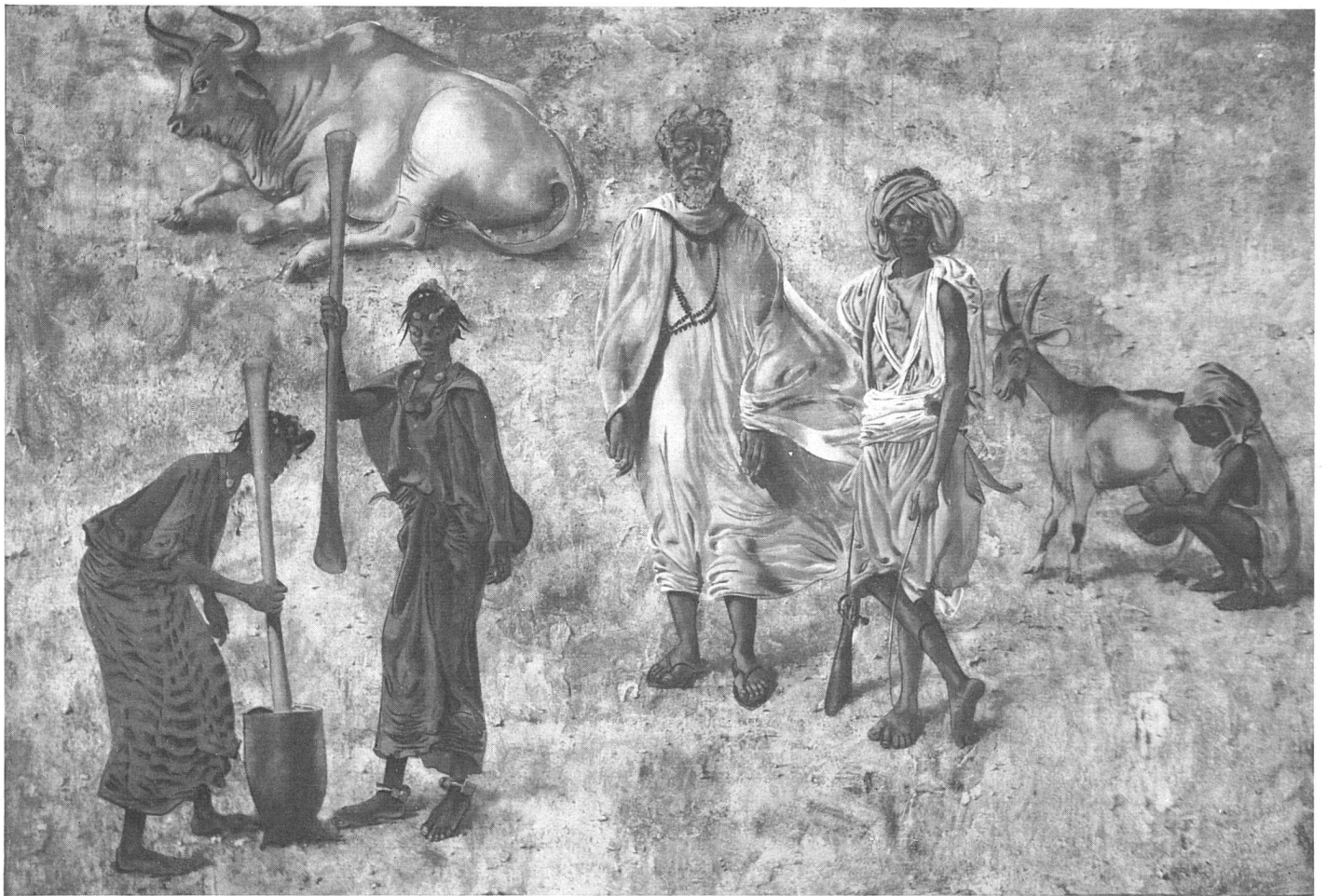
Hans Erni, Mauretanië, Die soziale und kulturelle Situation. Fresko im Altbau / La Mauritanie; société et culture. Fresque dans le bâtiment ancien / Mauritania, The Social and Cultural Situation. Fresco in the old building Photo: Hans Erni