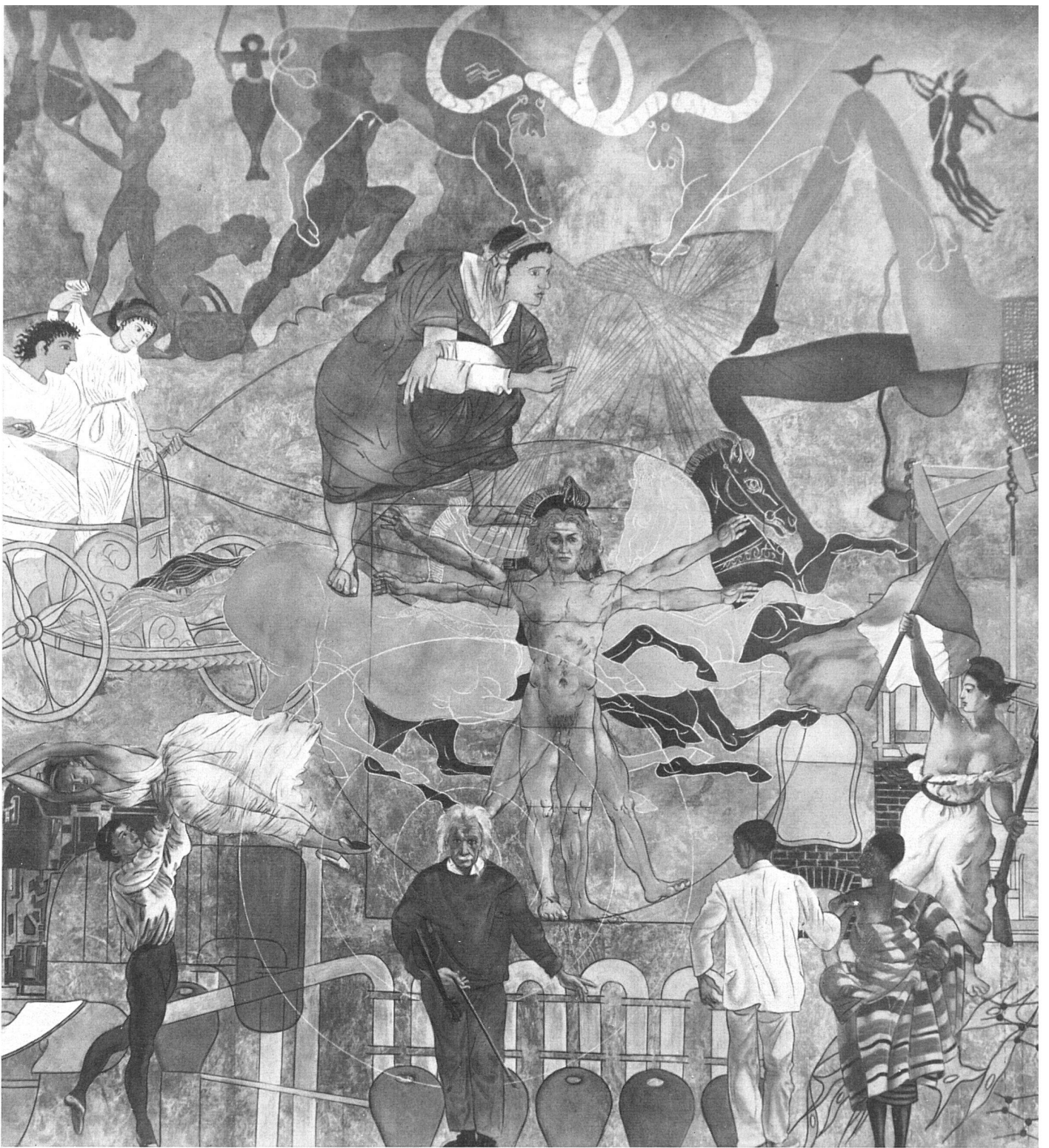
Hans Erni, Die europäische Kultur. Detail des Freskos | La Culture européenne (détail de la fresque) | The European Culture. Detail of the fresco

In diesem Kulturpanorama nimmt Hans Erni die künstlerische Problematik seines großen Wandbildes, «Die Schweiz, das Ferienland der Völker», an der Schweizerischen Landesausstellung von 1939, wieder auf. Wie dort verwendet er genaue Bildzitate. Dabei geht er noch weiter, indem er jede Kulturepoche auch durch ihre eigene Bildform charakterisiert; er vereinigt in der gleichen Komposition die Linien-