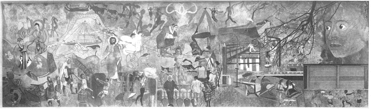
Gesamtansicht des Freskos von Hans Erni | La fresque de Hans Erni; vue d'ensemble | General view of Hans Erni's fresco