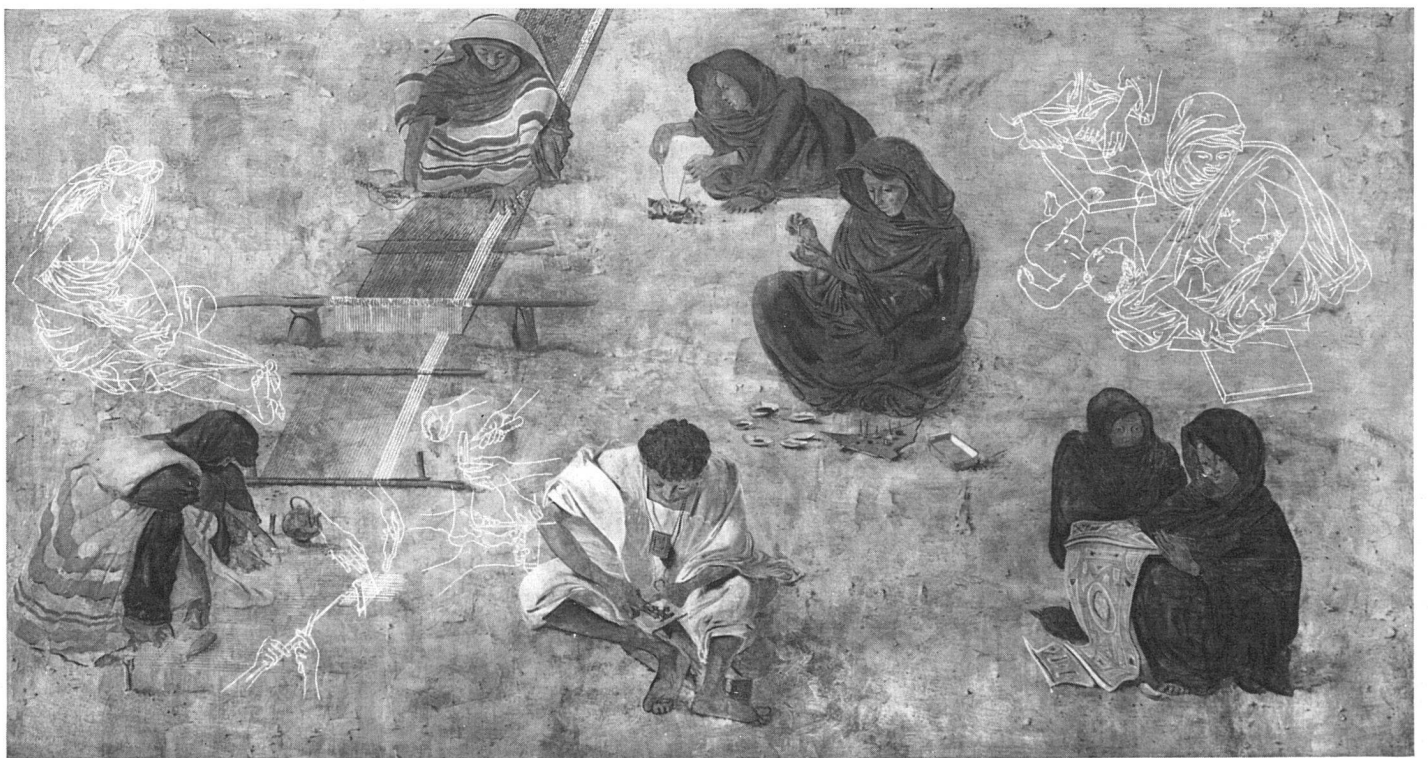
Hans Erni, Mauretanië, Bild des Handwerks. Fresko im Altbau / La Mauritanie; le travail artisanal. Fresque dans le bâtiment ancien / Mauritania, Handicraft. Fresco in the old building