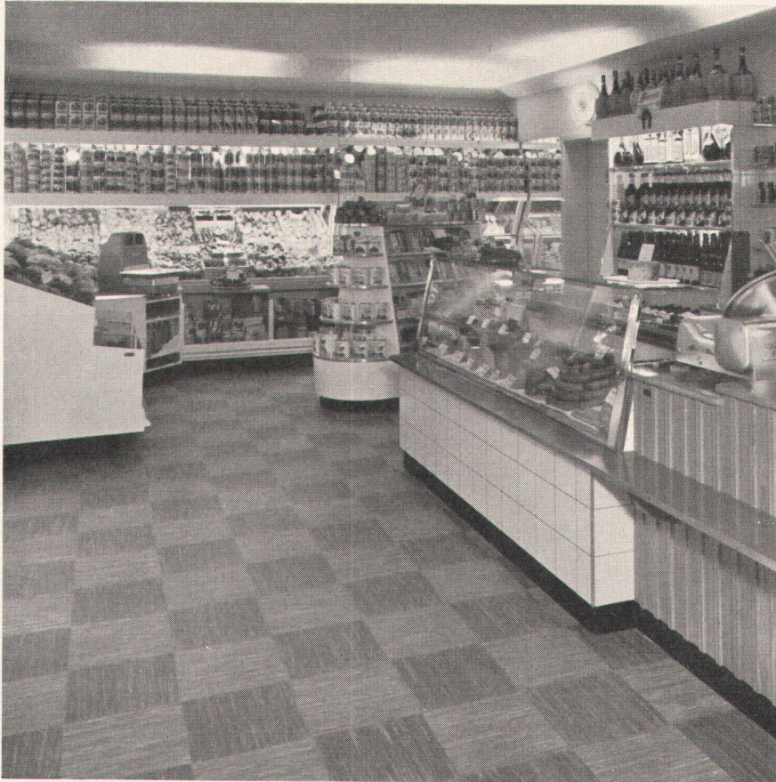
Comestibles G. Gisler, Altdorf