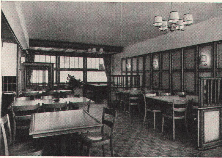
Restaurant, Täfer in NOVOPAN, naturbearbeitet