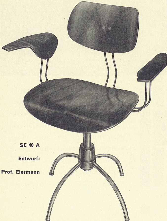
SE 40 A

Rudolf Meer GmbH Frankfurt a. M. Steinenweg 7 Tel. 96419