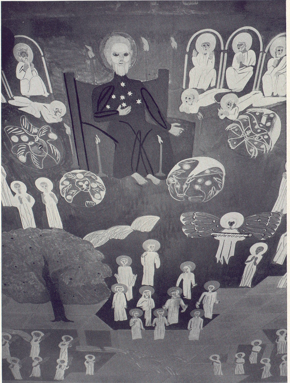
4 Ferdinand Gehr, Das ewige Jerusalem. Deckengemälde in der Maihof- kapelle in Luzern La Jérusalem céleste. Plafond peint de la chapelle Maihof, Lucerne The New Jerusalem. Ceiling painting in the Maihof Chapel in Lucerne