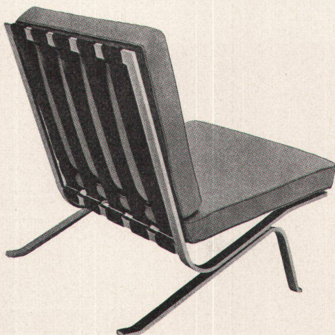
4 Fauteuil. Gestell Federstahlband verchromt, mit Ledergurten verspannt, Polsterkissen mit farbigem Leder bezogen Entwurf: Walter Frey SWB, um 1958