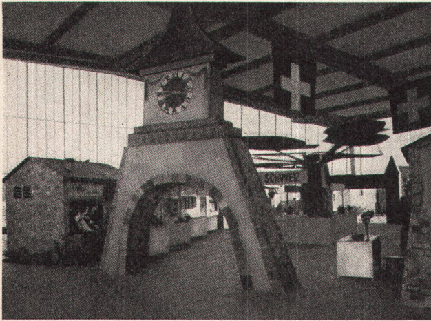
Das Schweizer Städtchen an der LEFA in Hamburg. Aus «Wirtschaftliche Mitteilungen».