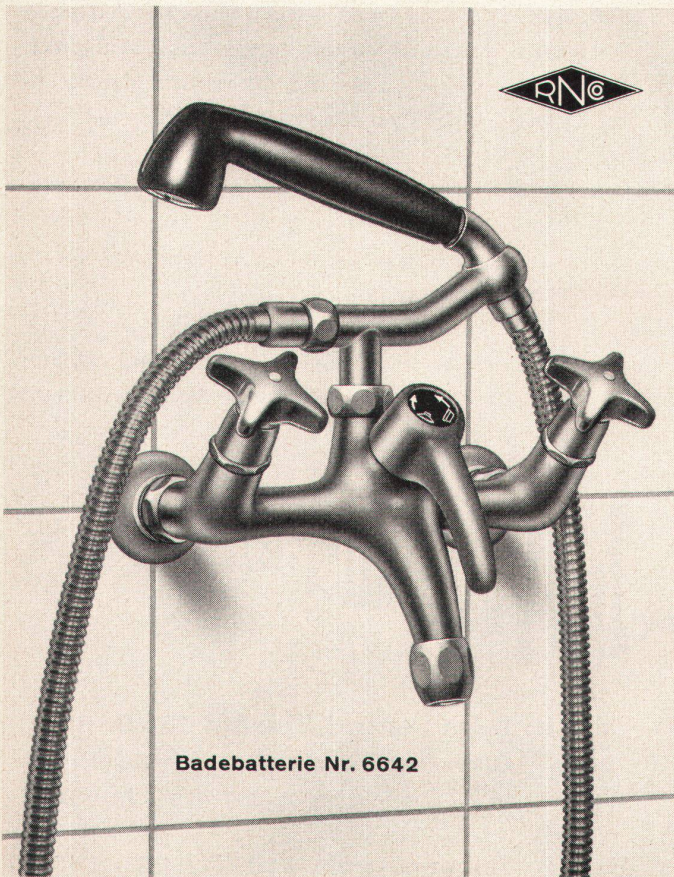
Badebatterie Nr. 6642