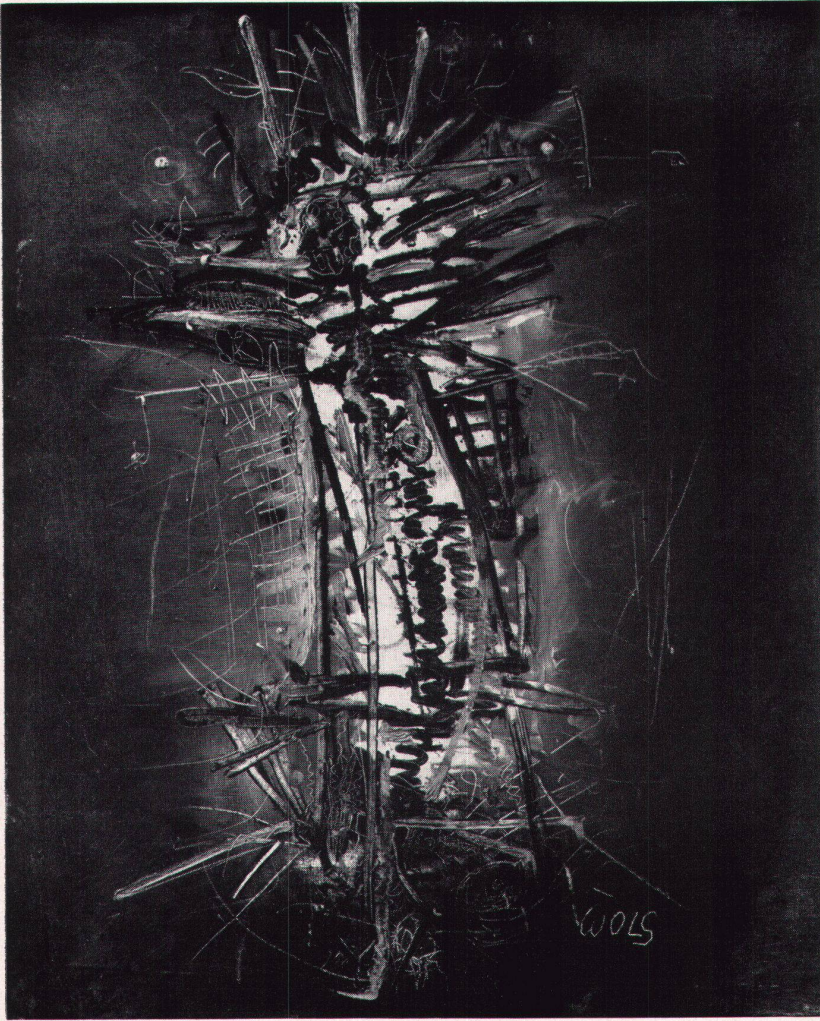
8 Wols, Letzte Komposition, 1951. Privatbesitz Paris Dernière Composition Last Composition

5. Die letzten Bilder kehren zur «Figur», zum Komplex (und dessen Absonderung vom Umraum) zurück. Ein farbig gesättigter Bildgrund, in der senkrechten Mittelachse eine aufgerissene Helligkeit, aber kein «Spalt» mehr, der an Wunden, an physische Verstümmelung gemahnt. Vielmehr ein farbiger Eklat, den die pinselführende Hand umgrenzt, eindämmt, bändigt, versperrt. Die Bildmittel sind reich gestaffelt: Kratzer, Schnörkel, dünner Zickzack, breite Farbsträhne, Flecken, deren Binnenform nadelfein aufgekrauselt wird, kurzlinige Farbspulen, die nach unten abrollen.