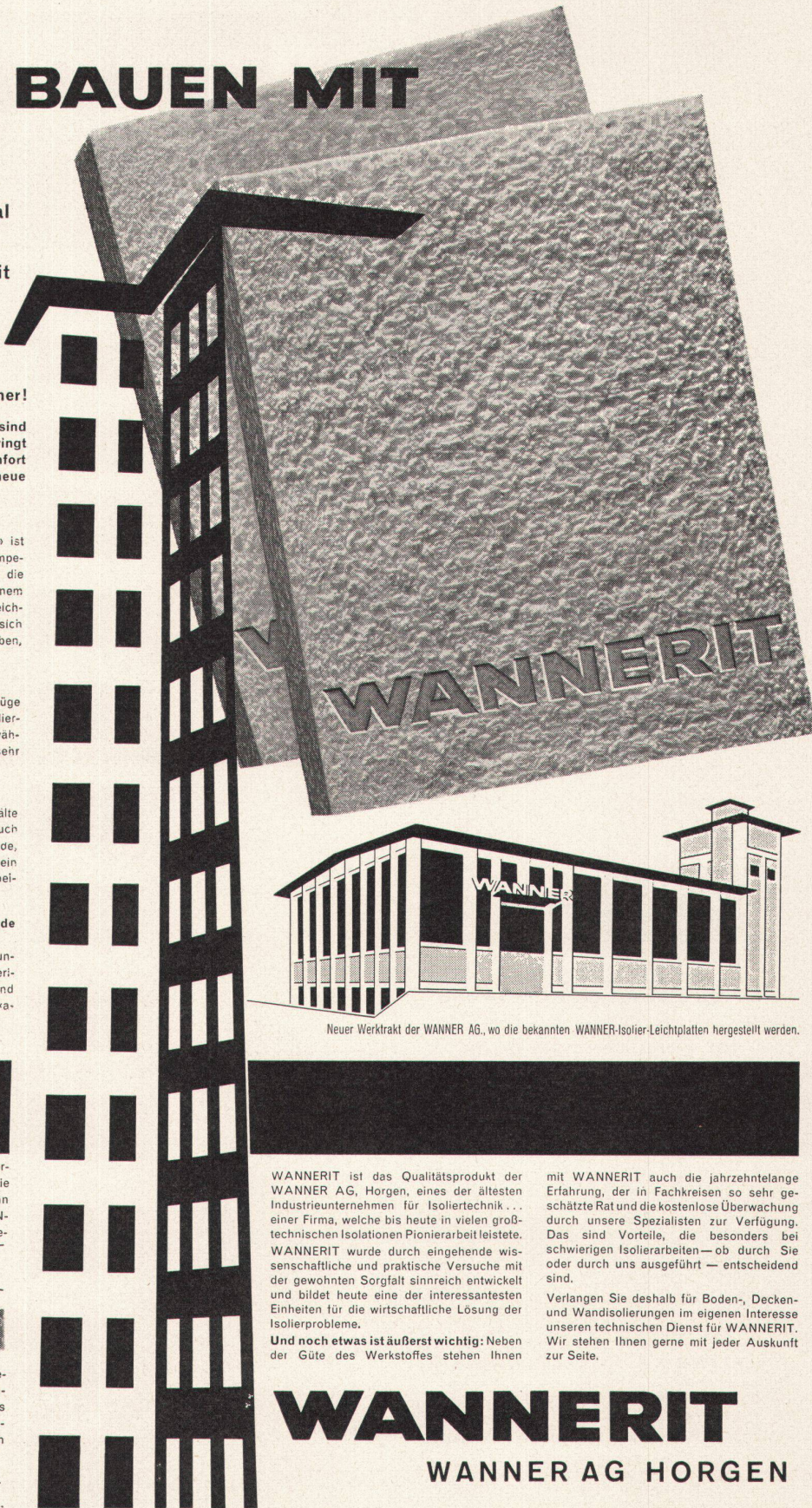
Neuer Werktrakt der WANNER AG , wo die bekannten WANNER -Isolier-Leichtplatten hergestellt werden.

WANNERIT ist das Qualitätsprodukt der WANNER AG , Horgen, eines der ältesten Industrieunternehmen für Isoliertechnik... einer Firma, welche bis heute in vielen großtechnischen Isolationen Pionierarbeit leistete. WANNERIT wurde durch eingehende wissenschaftliche und praktische Versuche mit der gewohnten Sorgfalt sinnreich entwickelt und bildet heute eine der interessantesten Einheiten für die wirtschaftliche Lösung der Isolierprobleme.