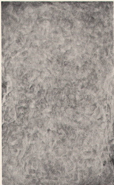
1 Sam Francis, White, 1952