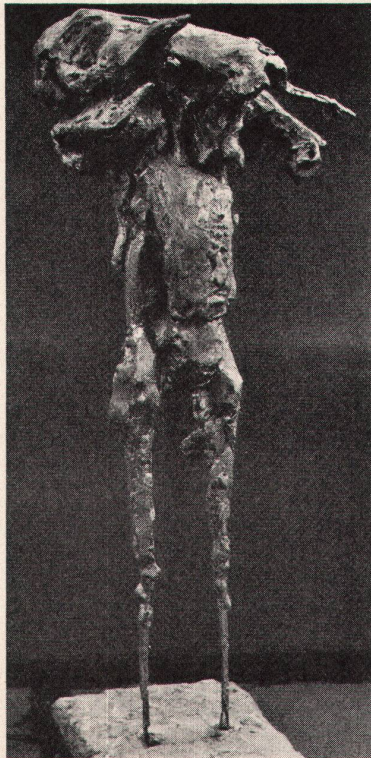
4 Barbara D. Chase, Man and Goat, 1960. Gips