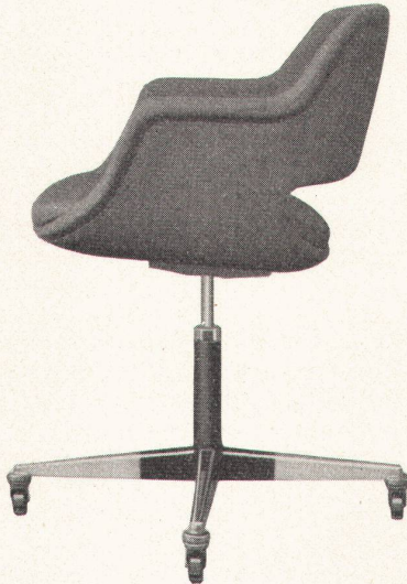
Atelier Woodtli Hausen/Brugg

Chefstuhl Mod. Mannermaa Typ Testa drehbar, Sitzschale mit Formhaar gepolstert, Sitzhöhe verstellbar Metallteile verchromt und schwarz gespritzt, ausgerüstet mit Gleiter oder Kugellagerrollen Stoff- oder Lederüberzug