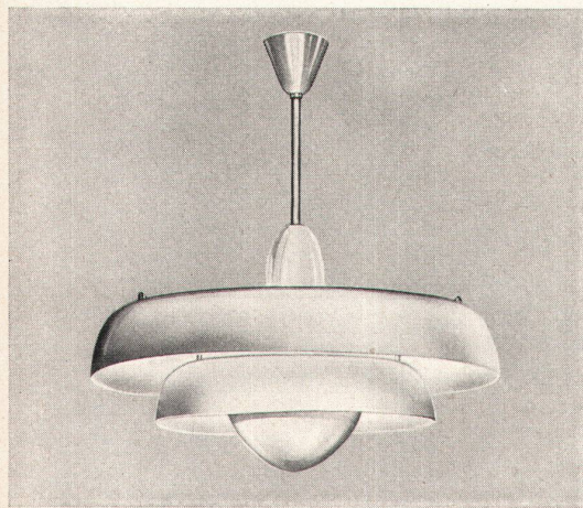
2712 «Stufen- leuchte»