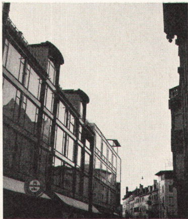
6 Alt und Neu – das eigene Gesicht und das der Nachbarn in der Glasfassade