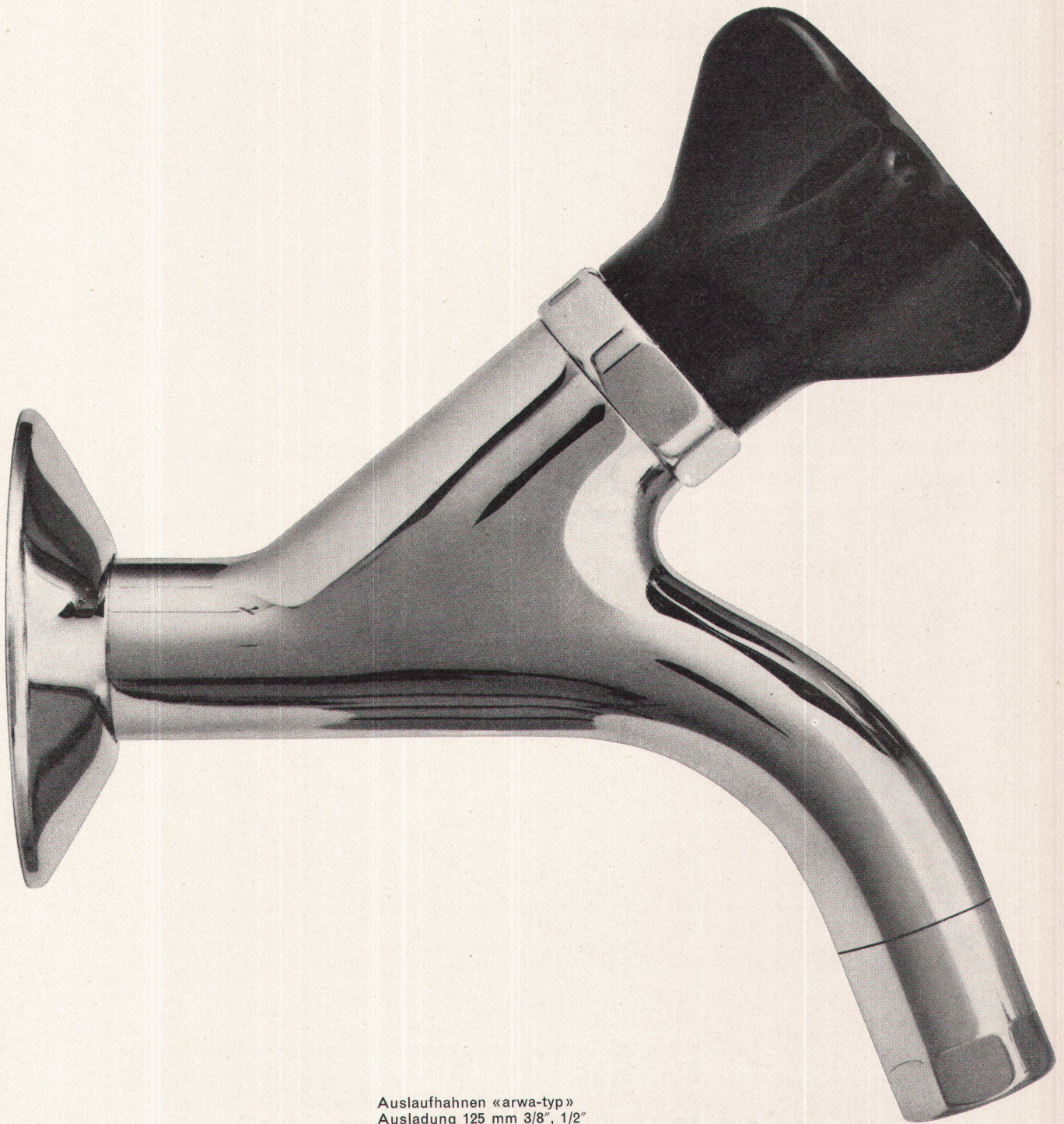
Auslaufhahnen «arwa-typ» Ausladung 125 mm 3/8", 1/2"

Armaturenfabrik Wallisellen AG Neue Winterthurerstraße 120 Telephon 051 93 31 77