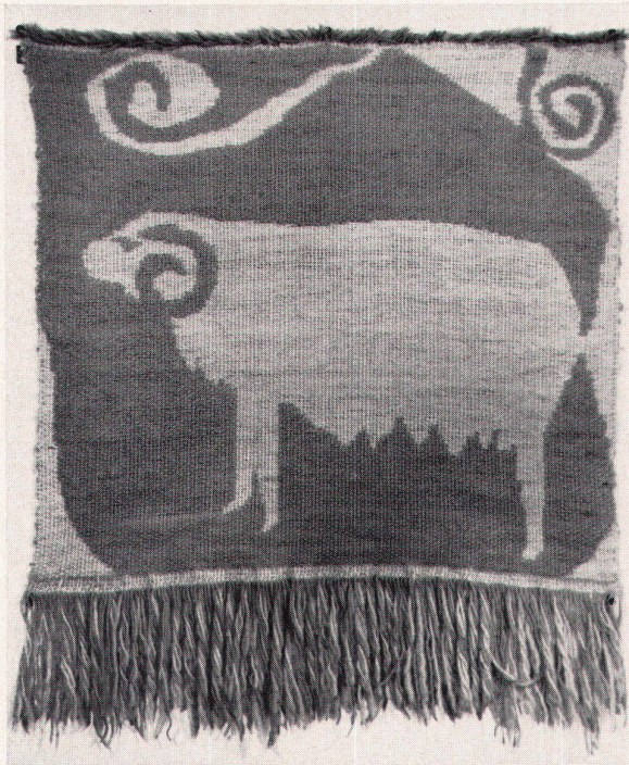
2 Eva Baumann, Schaf, 1956. Stabdoppelgewebe. Privatbesitz. Durch die Technik bedingte Gesetzmäßigkeiten ergeben Formen, die eine Verwandtschaft zur Volkskunst erkennen lassen Mouton. Tapis tissé Sheep. Woven carpet