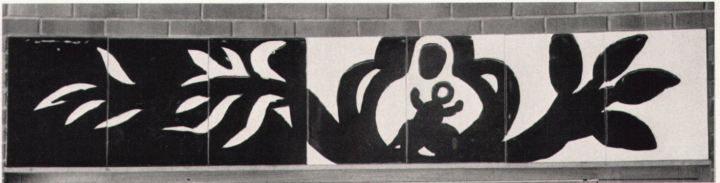
1 Ferdinand Gehr, Das Reis Jesse. Keramikplatten in der katholischen Kirche Winterthur-Wülflingen. Volkstümliche Elemente sind spürbar, aber schwer nachzuweisen Virga Jesse. Céramique en blanc et noir Virga Jesse. Black-and-white ceramic

Volkskunst ist für eine gesellschaftlich geschlossene Volksgruppe verbindlich. Sie wächst in fühlbarer Nähe einer höheren Kultur, unterscheidet sich jedoch grundsätzlich von deren Struktur. Sie ist nicht in den führenden Volksschichten zu Hause; weitaus am häufigsten tritt sie bei Bauern auf. Sie ist nicht provinziell vergrößerte hohe Kunst. Anderen Gesetzmäßigkeiten unterworfen als die Kunst, in deren Nähe sie auftritt, wurde sie jeweils von deren Trägern gar nicht beachtet. Volkskunst ist für uns heute erst allgemein zugänglich geworden, nachdem sich die Situation veränderte gegenüber der Zeit, in der sie entstand – nachdem sie historisch geworden ist. Was sich heute als neu entstandene «Volkskunst» anbietet, hat mit Volkskunst nichts zu tun. Es ist Nachahmung oder Fälschung – sonst müßte es sich verwandelt haben in Dinge, die unserer heutigen Situation entsprechen, denn es erfüllt nicht mehr die Funktion, welche der Volkskunst zukam. Volkskunst hat sich nie angeboten außerhalb der Umgebung, in der sie wuchs. Und vor allem hat sie sich niemals als «Volkskunst» angeboten, solange sie lebendig war, sondern als einzig richtigen, seinen Zweck erfüllenden Schmuck für seinen Ort, als Kunst also wie alle andere Kunst.