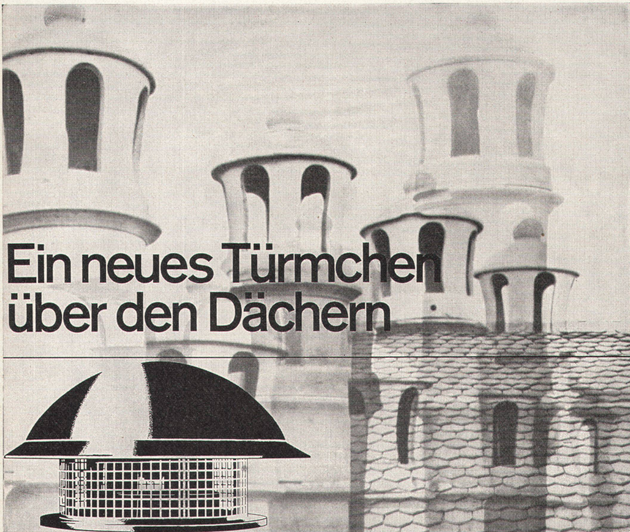
Der Dach-Luftabsauger MARELLI TR für Abluftschächte und -kanäle.

Wie schlecht ist oft die Luft unter den Dächern, gesättigt mit schlechten Gerüchen, mit Rauch, Staub und Dämpfen, verschmutzt und verdorben . . . und darin sollen wir atmen!