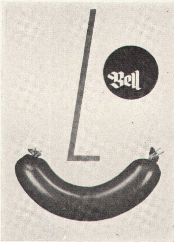
Celestino Piatti, Riehen