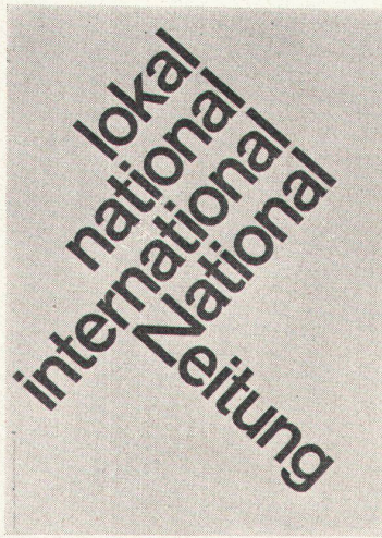
Gerstner + Kutter, Basel