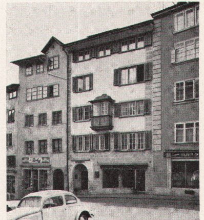
6 Es gibt auch gute Beispiele von Renovationen, wie es dieser Hausbesitzer und sein Architekt bewiesen haben. Das oberste Geschoß wurde nachträglich aufgesetzt und fügt sich harmonisch in das Gesamtbild ein