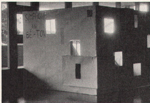
Schon sind die Plagiatoren am Werk – die Schuljugend von Aesch parodiert das neue Schulhaus

diesen Sätzen einzuleiten. Aber dem auf Würde und Sachlichkeit bedachten WERK und seinem neuen Redaktor kann solcher Enthusiasmus nicht zugemutet werden, und der Kommentator will sich deshalb bemühen, das Problem der «Neuen Freiheit» in aller Sachlichkeit einer Analyse zu unterziehen. Er kommt damit auch einem oft geäußerten Wunsch verschiedener Architekten entgegen, die heute nicht wissen, ob und wie sie sich der Bewegung «Neue Freiheit» anschließen sollen. Diese Ratlosigkeit ist bei der heutigen Geschäftslage und bei dem schnellen Wechsel der Richtungen in der internationalen Architektur verständlich. Die Architekten stehen dabei vor einem ähnlichen Dilemma wie mancher währschafte Künstler, der bisher mit abstrakter und konkreter Malerei redlich sein Brot verdient hat und sich nun plötzlich dem großen Erfolg versprechenden Tachismus und der einfach zu handhabenden «Fallenkunst» gegenüberübersieht. Nicht jedem wird jedoch der Übergang zur neuen Freiheit so leicht fallen wie dem oben erwähnten Architekten.