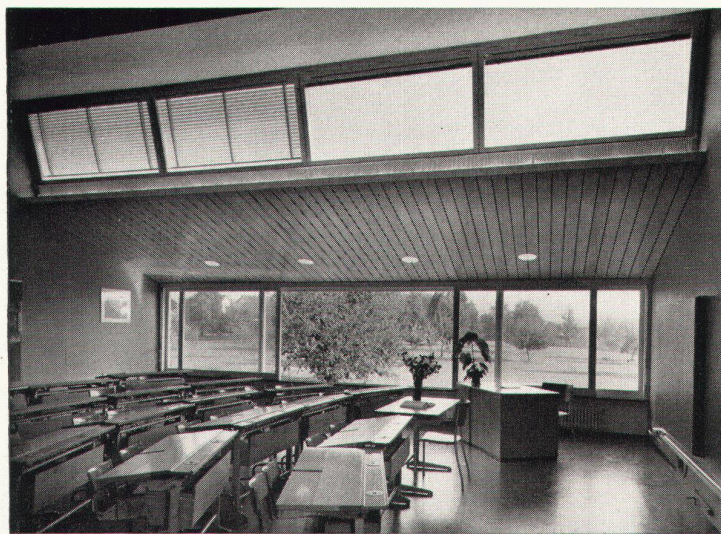
Schulhaus Obfelden ZH