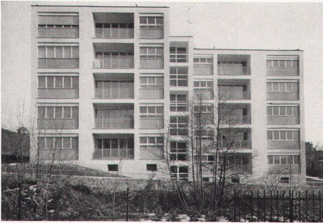
9 Miethaus in Lutry. Architekt: Alberto Sartoris BSA/SIA, Lutry