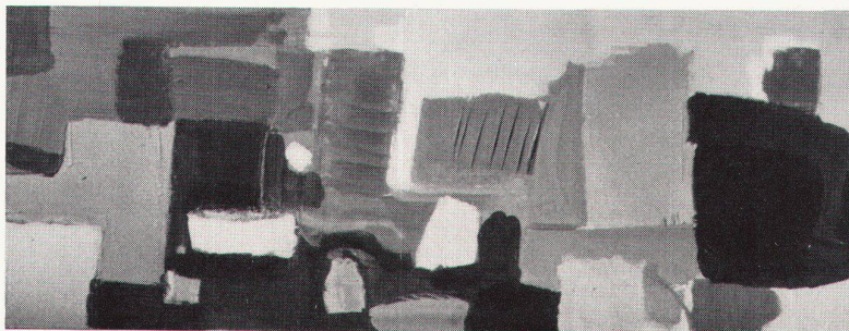
Diogo Graf, Öl auf Pavatex, 1956

seinem Werk ab. Mit den Bildnissen seiner Kinder schuf er wohl seine erfülltesten Malereien, und später ist er im «Nebelspalter» tapfer gegen die neuen Herren Deutschlands aufgetreten.