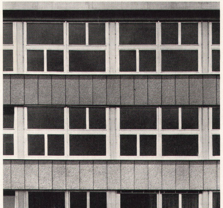
Schulhaus Wolfsmatt, Dietikon