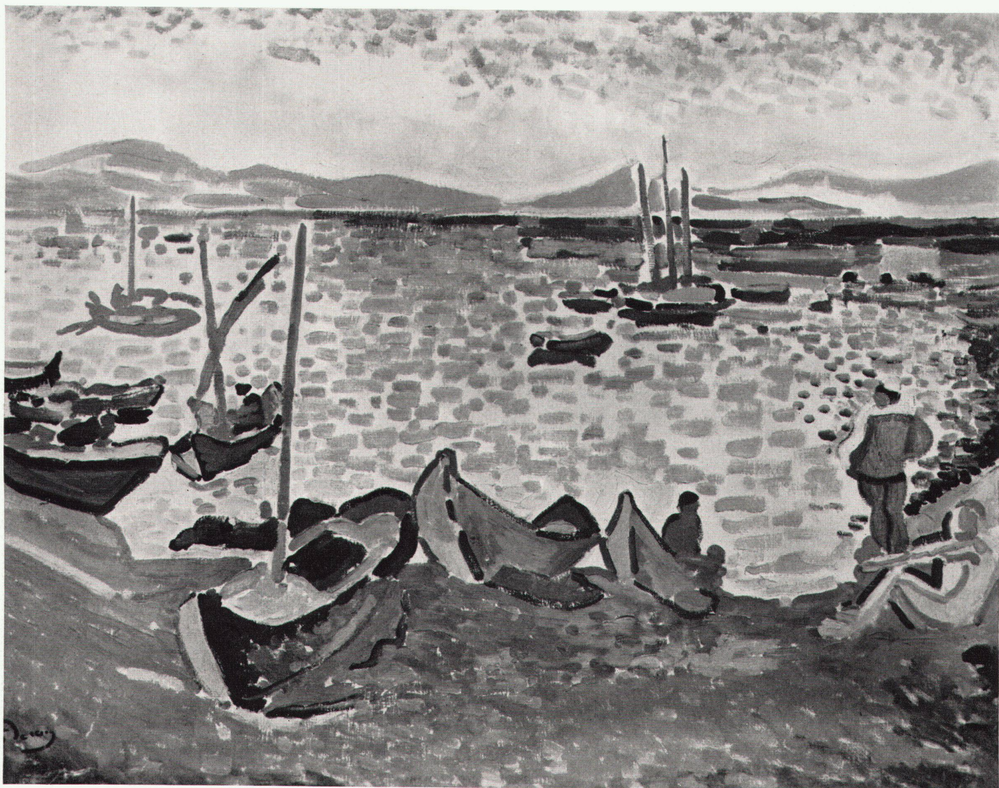
André Derain: Bateaux dans le port (1906). Collection particulière, Berne

Les occasions de voir des tableaux de la grande période fauve sont rares. Le mouvement ne dura guère, chacun de ses animateurs s'engageant rapidement dans une voie plus personnelle, et les collections ont eu tôt fait de s'assurer des témoignages aussi précieux d'un chapitre essentiel de l'art moderne. C'est donc une aubaine que de tomber sur ce paysage exécuté par Derain lors de son premier séjour dans le Midi, à Collioure, l'une des belles réussites de cette période. Doublement, puisqu'il s'agit d'une œuvre d'un des initiateurs d'une école dont la paternité est souvent discutée. Or, le fauvisme est bien né avant tout de cette éphémère Ecole de Chatou qu'à l'âge de vingt ans créèrent Vlaminck et Derain et qui se limita à eux deux. Ce tableau fut peint six ans après leur première rencontre. Entre-temps, ils avaient découvert l'art de Van Gogh dans une galerie de la rue Laffitte, à la stupéfaction du premier devant des tons éclatants bien proches de la couleur qu'il voulait «telle qu'elle sort du tube». Ils avaient aussi fait la rencontre de Matisse qui, s'il arriva troisième, devait par sa supériorité intellectuelle devenir chef du mouvement et le conduire au succès. Vlaminck n'était guère influençable, et Derain conserve lui-même son esprit critique en présence des théo-