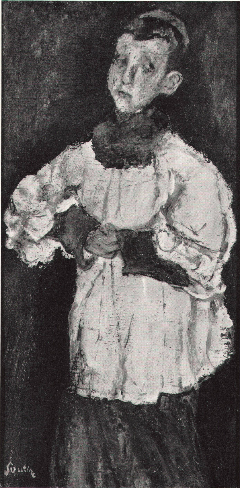
Chaïm Soutine: L'enfant de chœur (1928). Collection Charles Im Obersteg, Genève