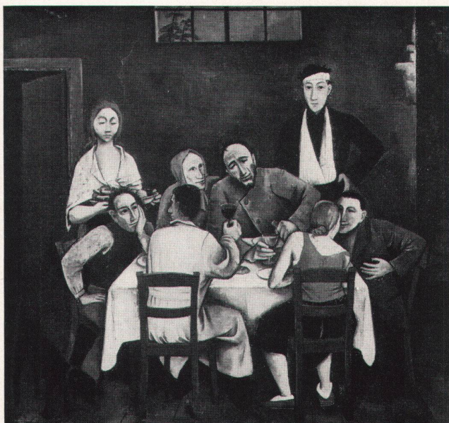
Karl Hofer, Tischgesellschaft, 1924, Kunstmuseum Winterthur