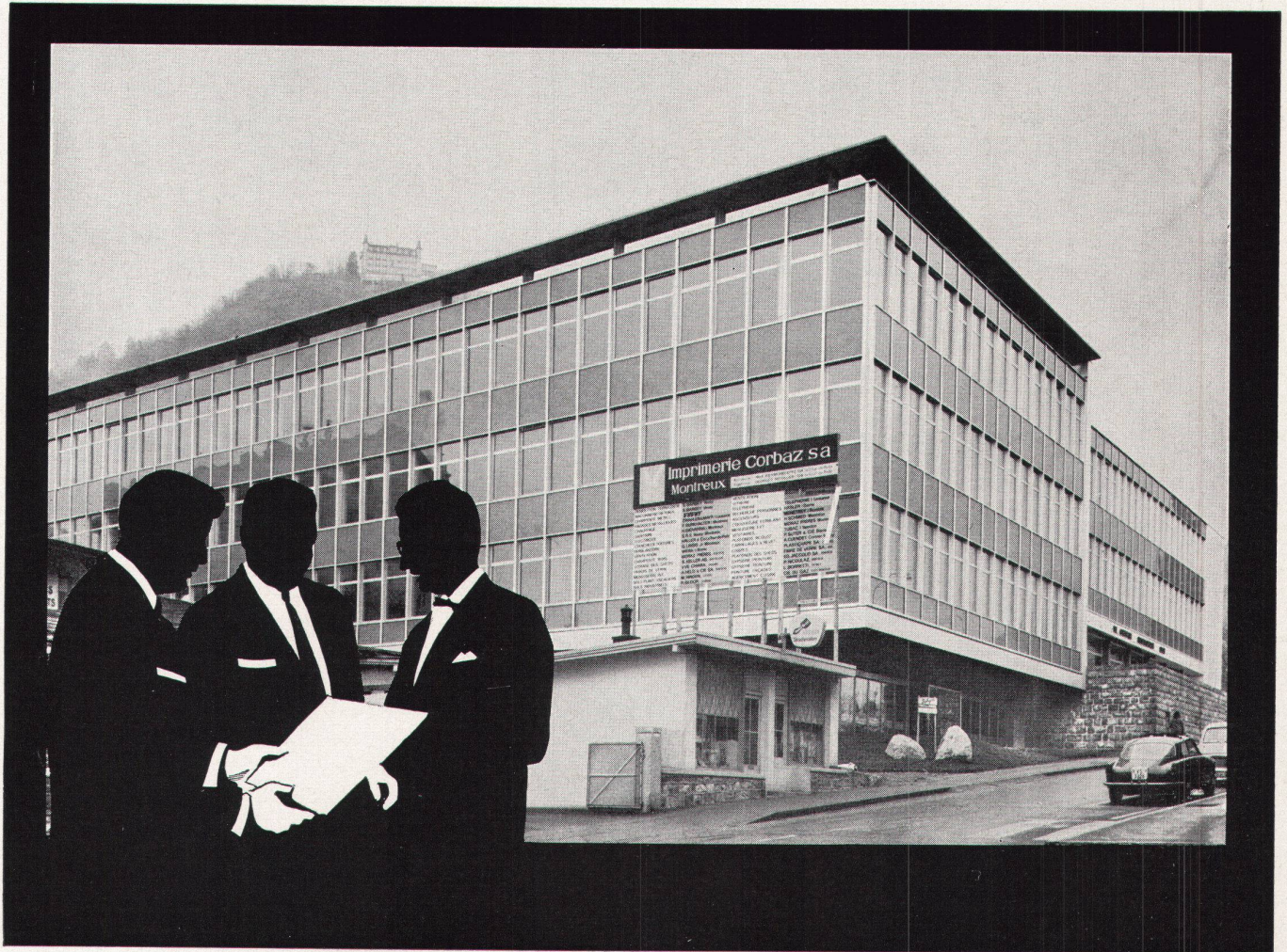
Imprimerie Corbaz SA, Montreux: Lufttechnische Spezialanlagen in der Druckerei und im Papierlager