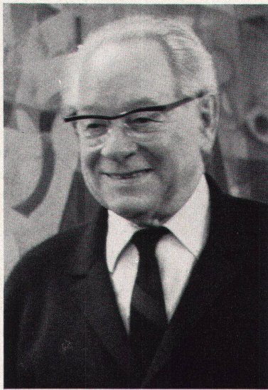
Johannes Itten. Aufnahme vom 7. März 1967