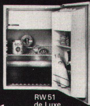
RW 51 de Luxe