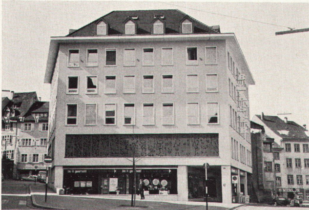
4 Pfluggasse Basel. Das Kaufhaus «Domus» im engen Altstadtmilieu gibt sich als das, was es ist. Ein gelungenes Beispiel außerhalb der Fittiche einer offiziellen Altstadtzone.