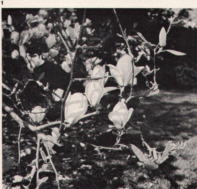
1, 2 Magnolia Soulanguiana