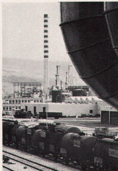
Raffinerie de Cressier SA • Gesamte Starkstrominstallationen in den Bauten

Dies sind nur 3 gute Gründe, sich bald mit den Fachleuten der HASLER INSTALLATIONS-AG zu besprechen... Denn wir verstehen uns auf die Lösung heikler Kommunikations- und Starkstromprobleme: