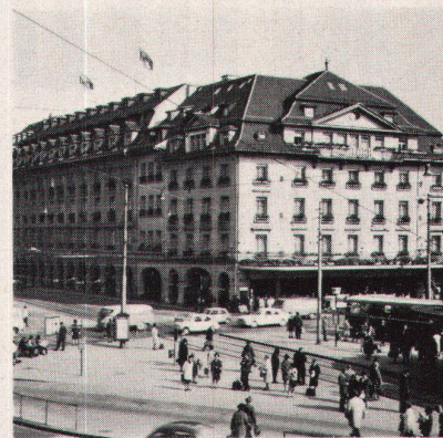
Gebr. Loeb AG, Bern • Starkstromanlagen (Licht, Kraft, Wärme) • Notstromversorgung • Telefonanlage • drahtlose Personensuchanlage HASLER • Gegensprechanlage • Uhrenanlage • Blitzschutzanlage/Projektierung und Installation

Beratung – Projektierung – Installation – Unterhalt