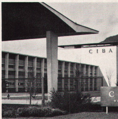
CIBA AG, Werk Stein • Telefonanlage • drahtlose Personensuchanlage HASLER • Bürolichtruf • Uhrenanlage • Signalanlage • manueller Feueralarm/Projektierung und Installation