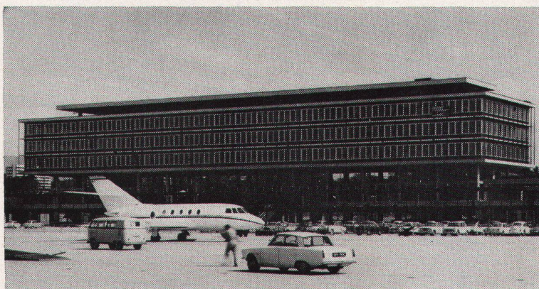
Flughafen Genf-Cointrin - Schweiz Arch. J. Camoletti & J. Ellenberger

Neben dem bereits bekannten goldfarbenen Sonnenschutzglas STOPRAY wird eine neue Ausführung, das purpurfarbene STOPRAY , hergestellt. Bemerkenswerte Reflexionseigenschaften zeichnen die STOPRAY-Sonnenschutzgläser aus: ca. 70 % der Wärmeinstrahlung wird abgehalten. Andere Sonnenschutzvorrichtungen werden in vielen Fällen überflüssig und die Kosten für den Bau und Betrieb einer Klimaanlage werden reduziert. STOPRAY, eine isolierende Verglasung Thermopane, ist ein Qualitätsprodukt der Glaverbel.