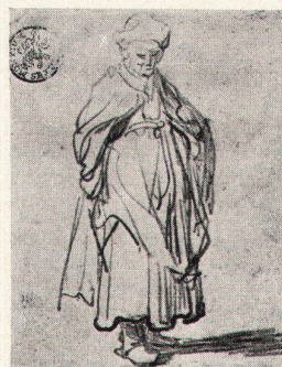
Basel, Kupferstichkabinett des Kunstmuseums Niederländische Handzeichnungen 21. Juni bis 17. August

Aus den Beständen des Düsseldorfer Kunstmuseums werden Handzeichnungen ausgestellt.