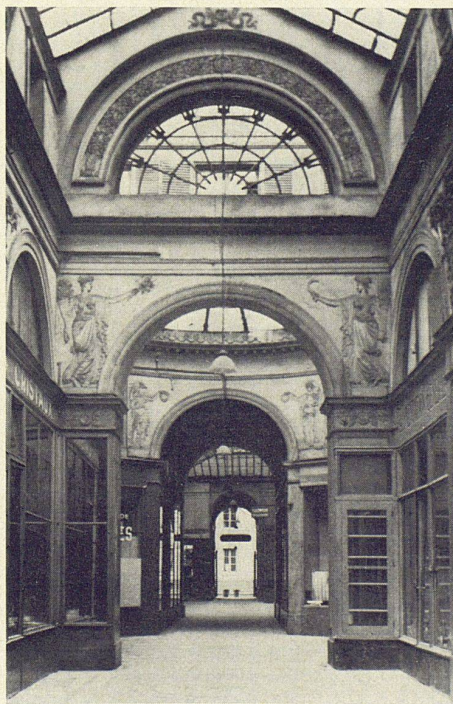
1 Galerie Vivienne, Paris II e

Es ist selbstverständlich, daß bei der Arbeit des jungen Architekten auch aktuelle Fragen eine Rolle spielen. Darüber Geist im Einleitungssatz des abschließenden Textkapitels «Projekt und Utopie»: Es ist unerlässlich ..., das Schicksal der Passage in das 20. Jahrhundert zu verfolgen, denn die Bauidee Passage rückt heute erneut in das Bewußtsein derer, die über die Zukunft der Stadt als Lebensform diskutieren und nach Veränderungen unter veränderten wirtschaftlichen, technischen und gesellschaftlichen Bedingungen suchen.» Gemeint ist die Passage als Präfiguration der verschiedenen Möglichkeiten der Piazza oder eines Systems von Sitz-, Diskussions-, Kauf- und Entspannungszentren, die im Nervensystem der Stadt zentrale Bedeutung besitzen. H. C.