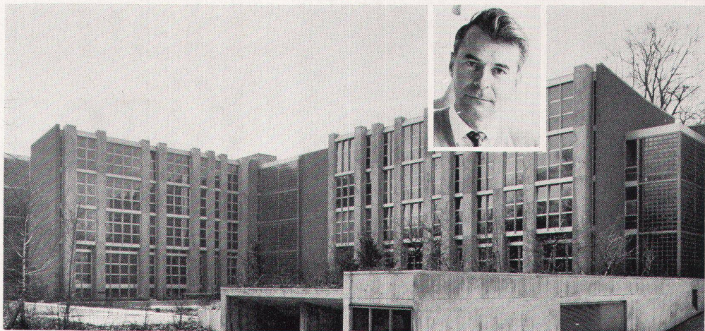
das neue Schulhaus Rämibühl in Zürich