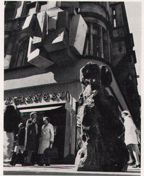
4 Farbkuben von Roland Goeschl