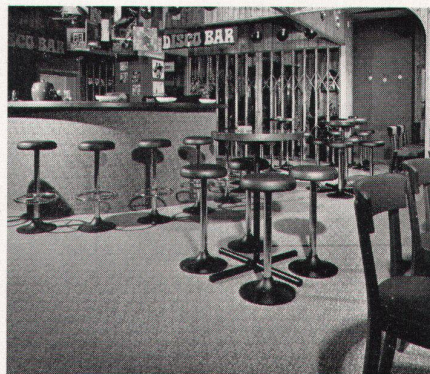
in Hotels und Restaurants