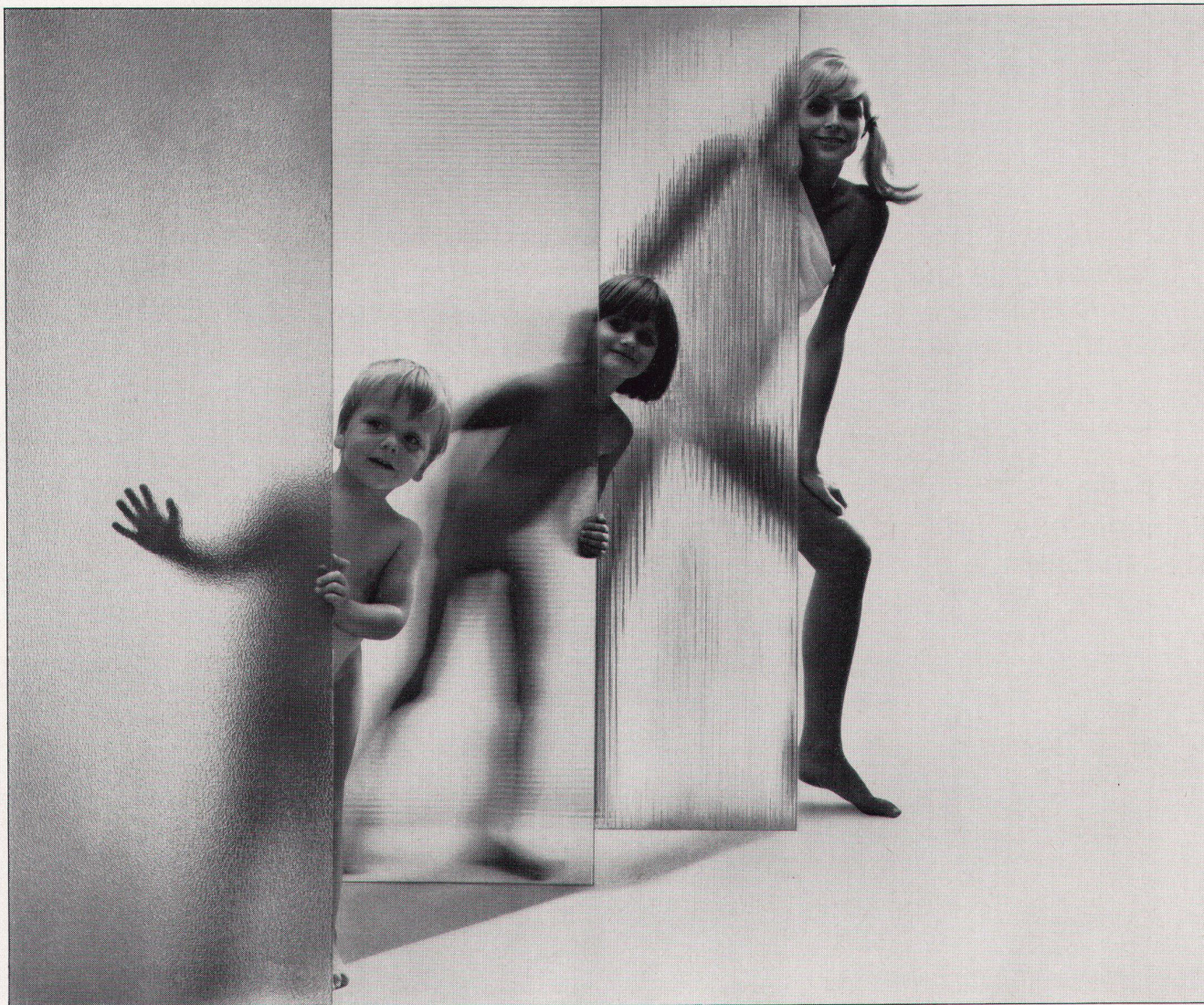
Ornamentscheiben aus Makrolon für Duschanlagen, Bäder, Krankenhäuser, Sportheime, Großindustrien