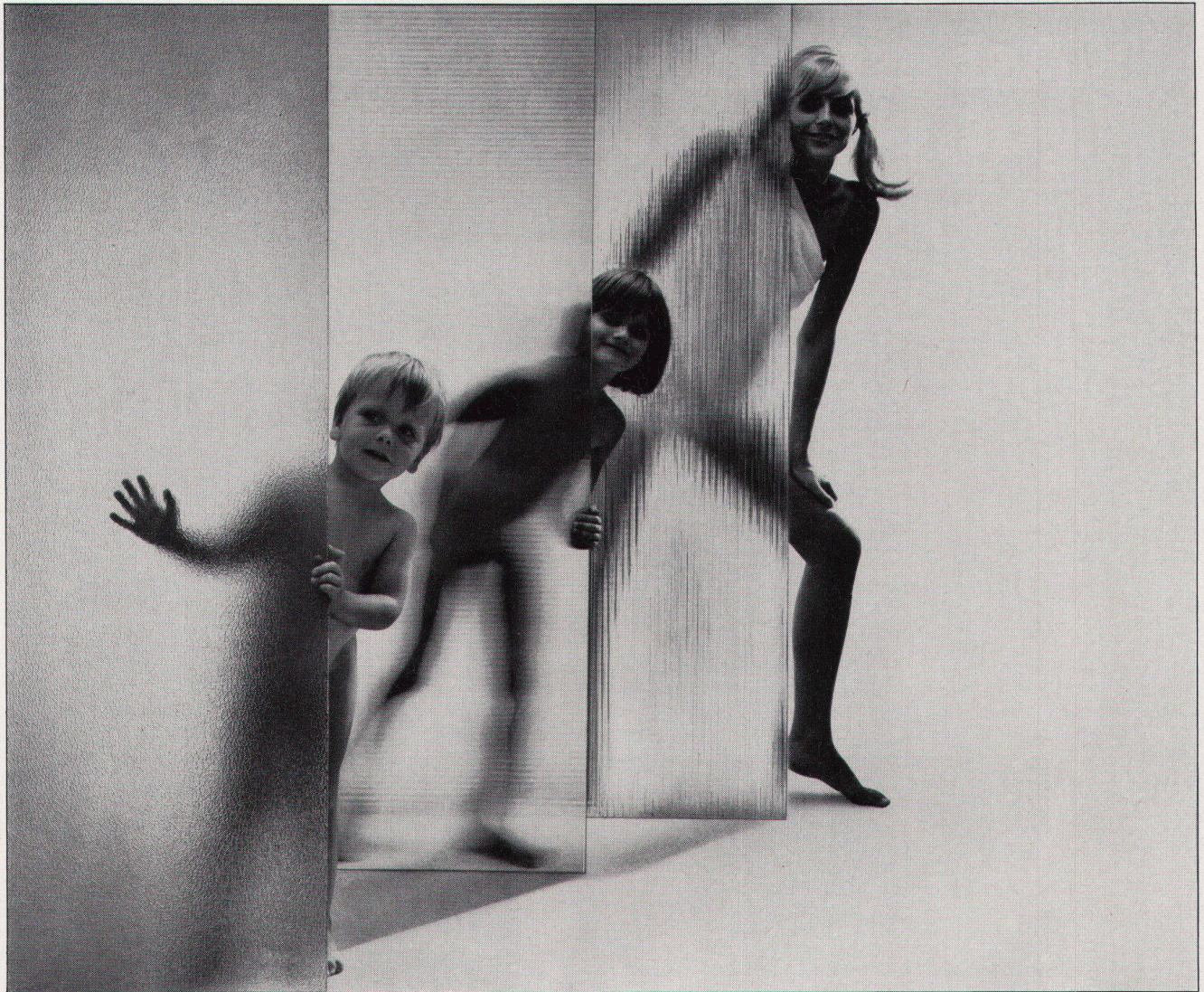
Ornamentscheiben aus Makrolon für Duschanlagen, Bäder, Krankenhäuser, Sportheime, Großindustrien