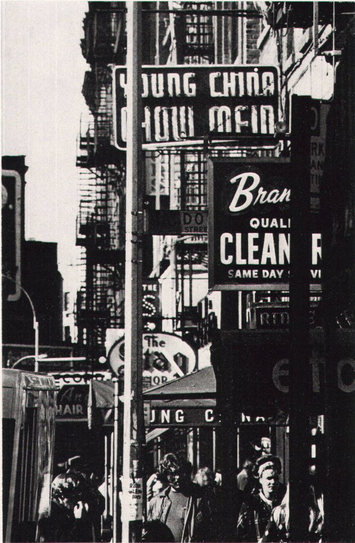
2 Der Fußgänger und die Zeichen

mentiert, eine Tätigkeit sei entweder standortverändernd oder standortkonstant. Dieses grobe Klassifizieren ist unter anderem deshalb schwierig, weil Tätigkeiten oft Elemente beider Extreme der benützten Beurteilungspaare enthalten; adäquatere Kennzeichnungen als «nicht das, sondern das» sind mithin «sowohl als auch» oder «mehr dies als das». Bummelt jemand durch eine Stadt, so geht er; er bleibt aber auch stehen, um etwa einen Baum anzuschauen, oder er setzt sich irgendwo hin, um auszuruhen. Jemand, der zu Fuß zur Arbeit unterwegs ist, übt nicht immer eine Tätigkeit aus, die alleine mittelbaren Zweckcharakter hat; sie kann gleichzeitig dem unmittelbaren Zweck dienen, die Morgenluft zu genießen und zu meditieren, übrigens zwei durch eine andere Person sinnlich nicht direkt wahrnehmbare Tätigkeiten. Zu-Fuß-Unterwegssein kann also bestehen aus mittelbaren und unmittelbaren, direkter Bedürfnisbefriedigung dienenden Verhaltenskomponenten, aus standortverändernden und standortkonstanten, aus sinnlich wahrnehmbaren und sinnlich nicht wahrnehmbaren.