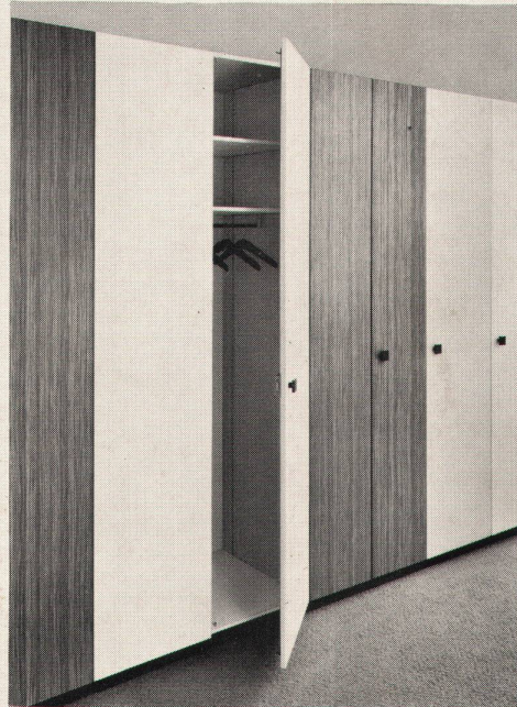
Das sind Wernle-Einbauschränke. Zum Beispiel.

Bitte ausfüllen und einsenden an: J. Wernle AG, Kirchbergstrasse 1030, 5024 Küttigen/Aarau. Danke.