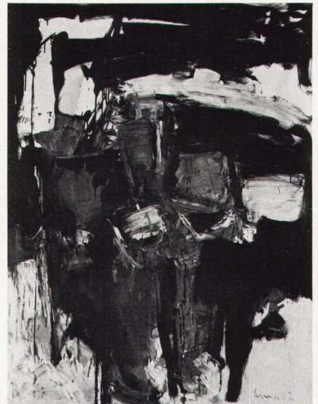
1 Carl Liner, Composition 1962

Depuis quelques années, la peinture de Carl Liner s'est dépouillée, favorisant la lecture d'une œuvre profondément humaine, sans fard, mais éclatante et émouvante.