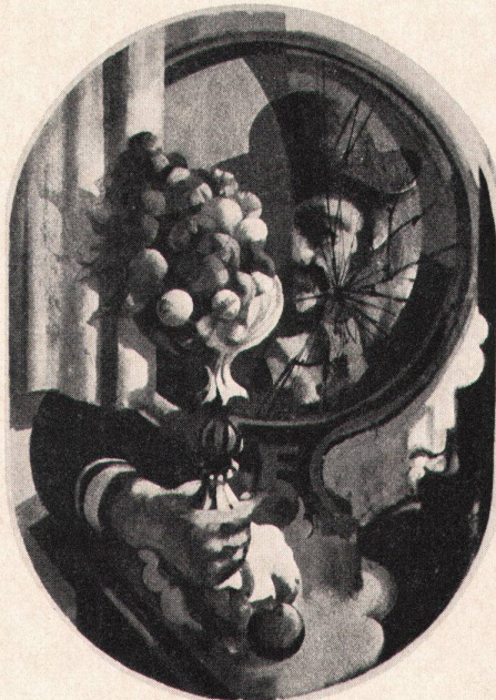
1 Peter Rüfenacht, Der Multirevoluzzer, 1970

Von seinen ovalen oder kreisförmigen Bildern sagt Peter Rüfenacht: «Ein gegenständliches Bild ist ein kleiner Weltspiegel, ein kleiner Ordnungsversuch als Spiegel des großen, alles einschließenden Ganzen.»