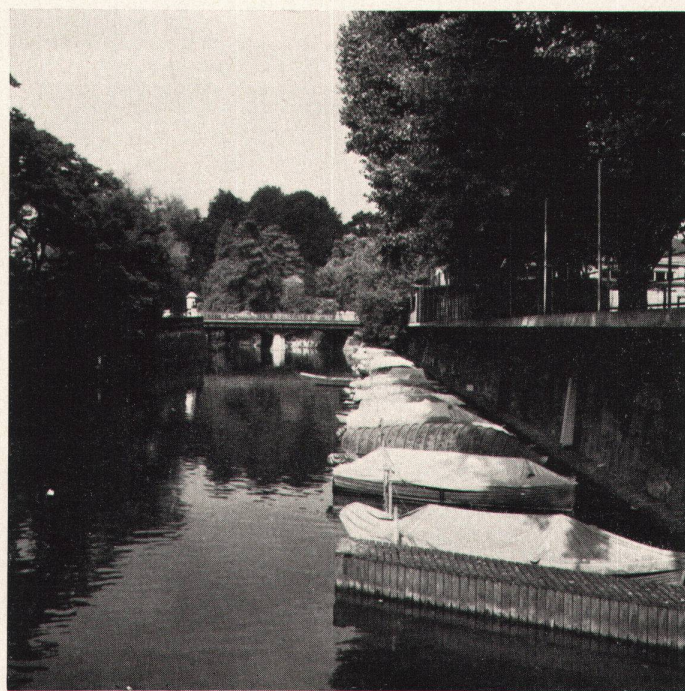
Der Schanzengraben vom Bären-Bruggli