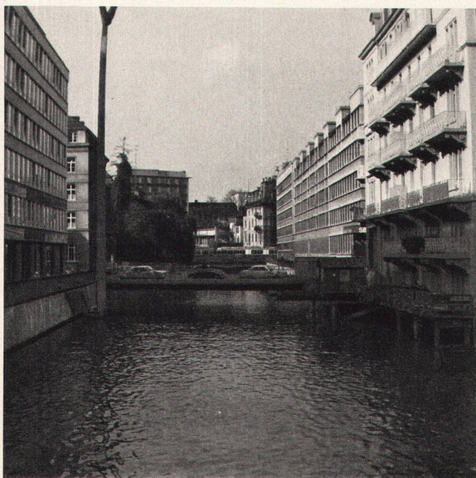
Der Schanzengraben vom General-Guisan-Quai

sind an allen Kreuzungspunkten mit den Querstraßen Zugangstreppen vorgesehen. Außerdem sollen an einzelnen Stellen Imbisskioske und Sitzgelegenheiten erstellt werden. Im kanalartigen Teil des Schanzengrabens bei der Börse sind zusätzliche Bepflanzungen mit Bäumen und überwachsenen Pergolas über den Fußgängerstegen vorgesehen. Die Konstruktion der Stege im Wasser besteht aus Bohrpfählen und vorgefertigten Elementen, die eingeschwemmt werden